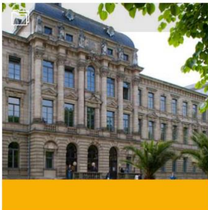
1. Philosophische Fakultät und Fachbereich Theologie