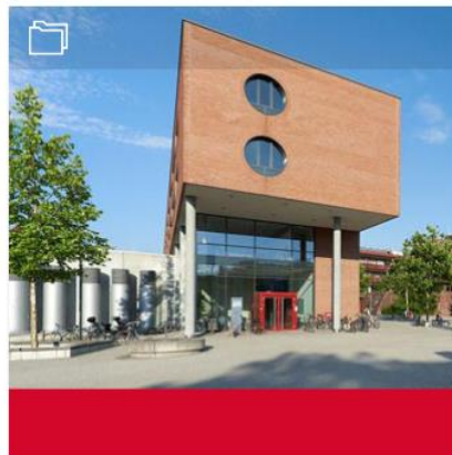
2. Rechts- und Wirtschaftswissenschaftliche Fakultät